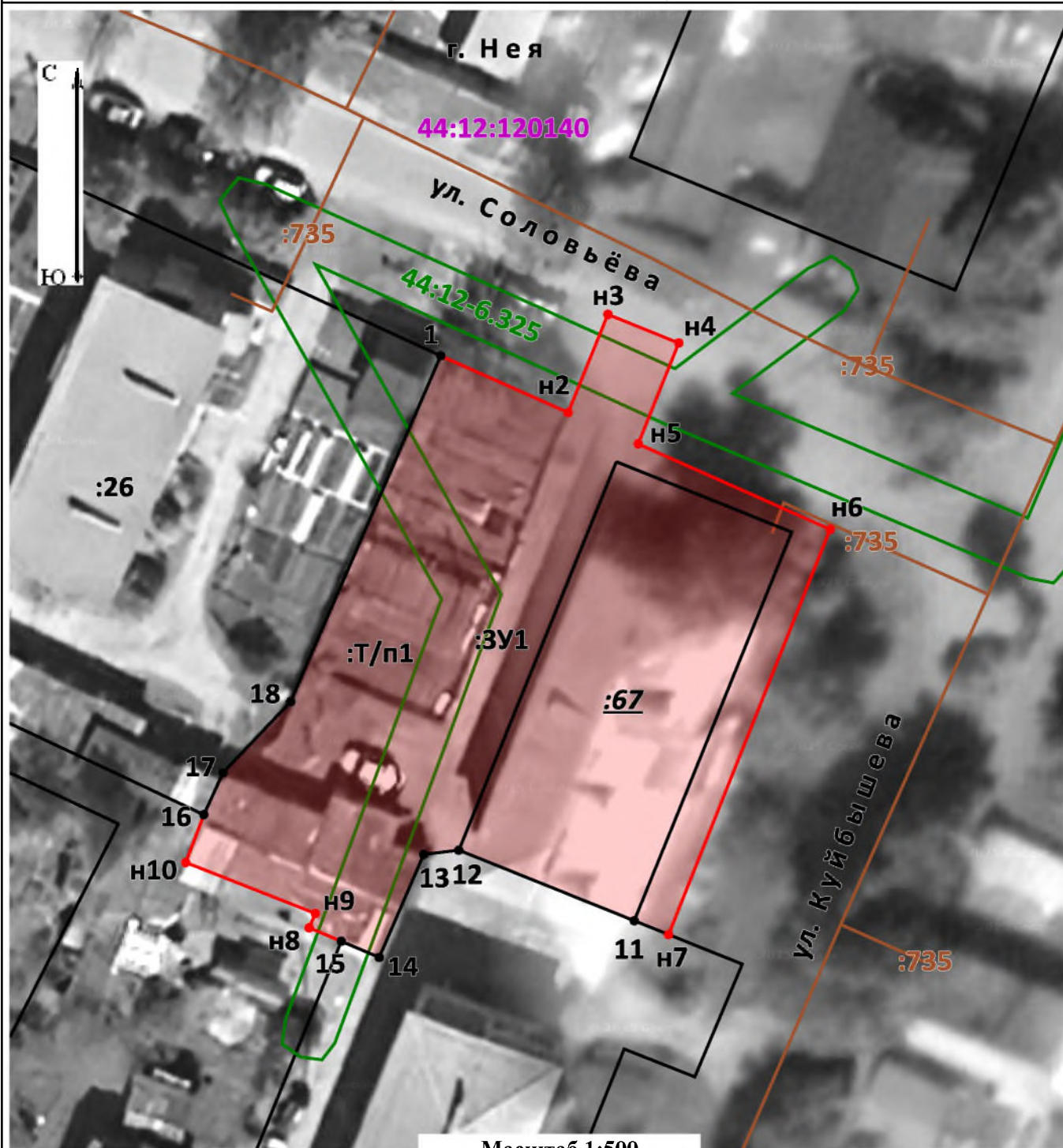
Схема расположения земельных участков